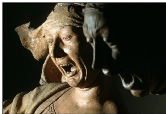
Niccolò dell'Arca, Particolare del Compianto sul Cristo morto , 1463, Bologna, Chiesa di Santa Maria della Vita