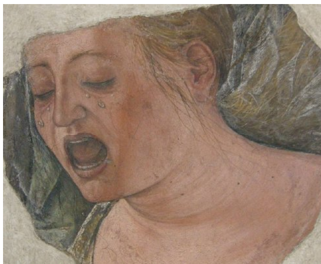
Ercole Roberti, Volto di Maria Maddalena piangente 1478/1486, Pinacoteca Nazionale di Bologna