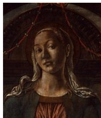
Francesco del Cossa, Pala dei Mercanti (part.) 1474, Pinacoteca Nazionale di Bologna

(P. Lamo, Graticola di Bologna , 1560, ed. 1996, p. 30).